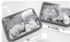
手づくりおべんとうはんや様 のり弁当3種1食につき 10円を寄付