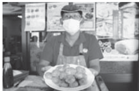
仲田精肉店様 お肉屋さんの手作りジャンボ焼売 売上金額の3%を寄付