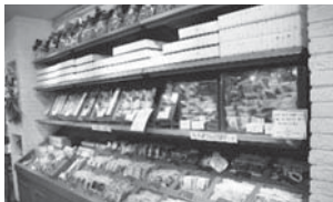
ラ・プロヴァンス様 ギフト菓子折1箱につき 50円を寄付

市内4店舗(ラ・プロヴァンス様・仲田精肉店様・手づくりおべんとうはんや様・グリルあらの様)のご協力をいただき、お店様でご指定いただいた商品を購入することで、寄付(募金)につながる取り組みです。多くの皆さまに募金のご協力をいただきました。