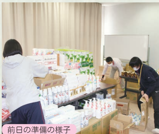
前日の準備の様子