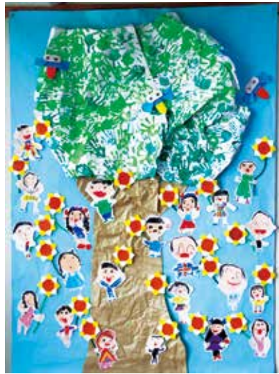
鉾田幼稚園 5歳児(ひまわり組)

「だいすき ひまわりぐみ」 ひまわりのようにまっすぐでやさしくあったかいみんながだいすき♪ こころにたくさんのおもいやりのはなをさかせて、これからもとんとんはばたいっていつてほしです!