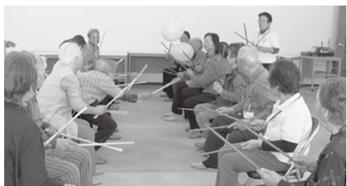
ひとり暮らし高齢者サロン