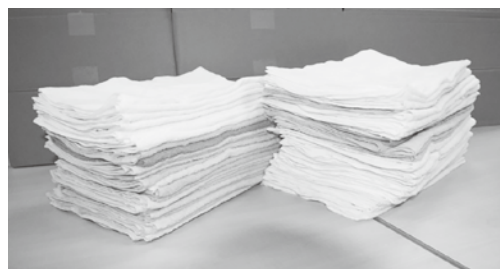
タオル・手ぬぐいなど