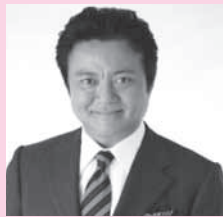
TBS「Nスタ ニュースアイ」キャスター