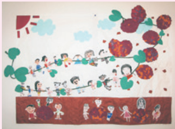
「いもほりにあったよ」

あどけない子どもたちが、絵をとおして福祉の「め」を育むことも大切です。 市内の保育所(園)や幼稚園にご協力をいただいております。