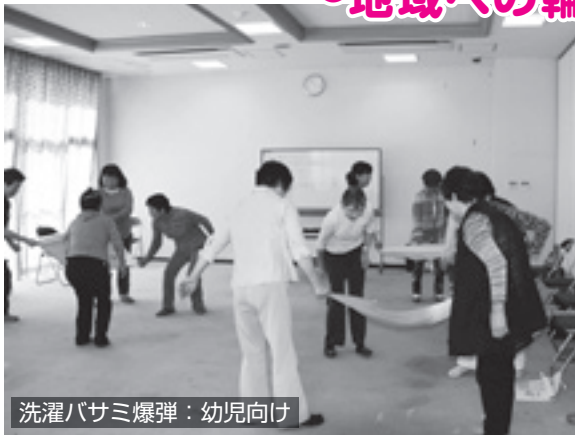
洗濯バサミ爆弾：幼児向け