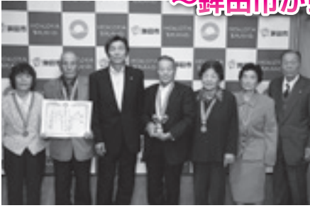
■輪投げの部 第三位 造谷第一高齢者クラブ