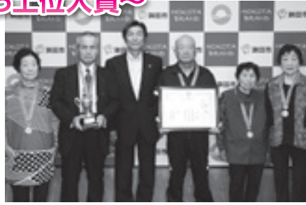
■クロッカーの部 優勝 なごみ会(子生地区)

10月22日(休)に茨城県及び県社協主催によるねんりんスポーツ大会が開催されました。