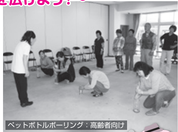
ペットボトルボーリング：高齢者向け

10月10日(金)と17日(金)の2日間、社会福祉協議会登録ボランティアの方を対象に高齢者・幼児に対するレクリエーション講座を開催しました。