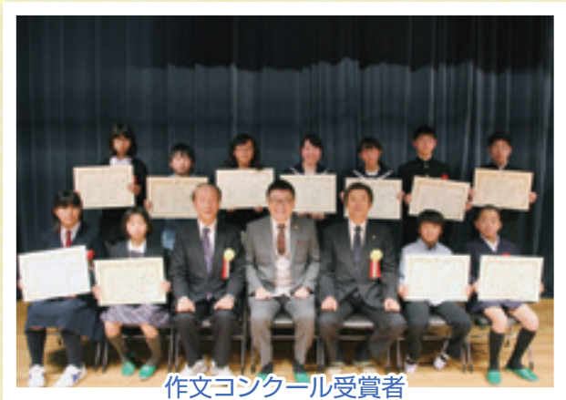
作文コンクール受賞者