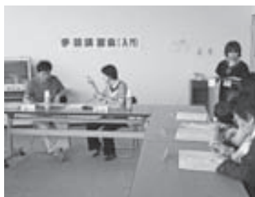
手話ボランティア養成講習会