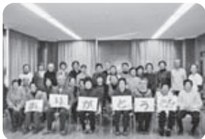
ひとり暮らし高齢者サロン 旭地区