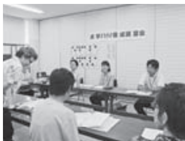
点字ボランティア養成講習会

受講いただいた皆様にはボランティア登録をしていただき、今後、特技や趣味などを活かした活動で活躍されることを期待いたします。