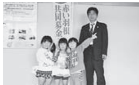
鉾田北幼稚園のみなさん