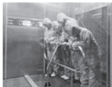
災害ボランティア養成講習会