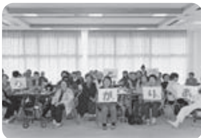
ひとり暮らし高齢者サロン 銚田地区