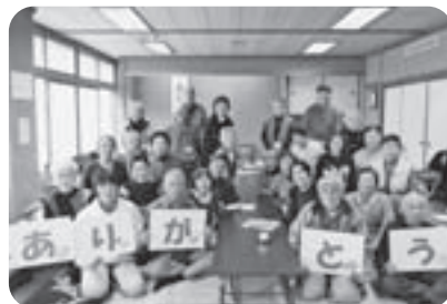
ひとり暮らし高齢者サロン 大洋地区

その他介護用品支給事業、星空映画会、新入学児童祝金支給事業、ボランティア養成講座、地域介護ヘルパー養成講座等、銚田市の地域福祉の充実に役立てられています。