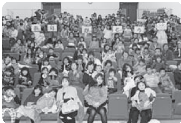
親子ふれあい事業