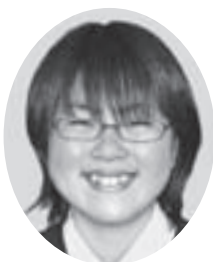
大洋中 2年 夢 飯 島 未