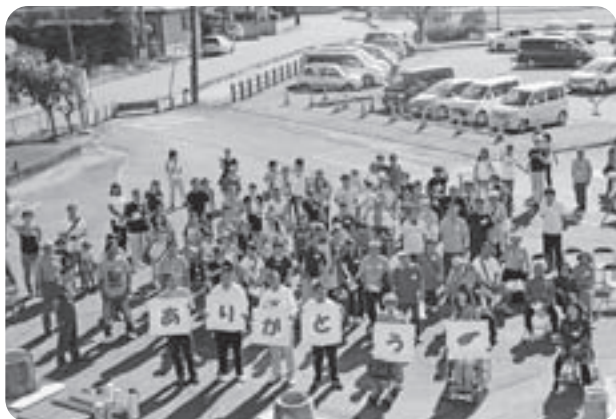
障害者ふれあい事業