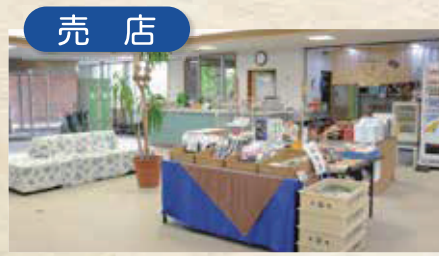
おみやげ等を販売 しておりますので、 ご利用ください。