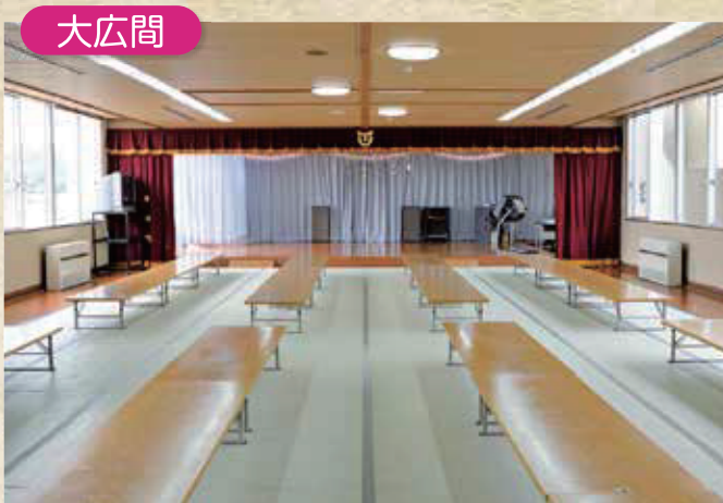
カラオケ・ダンス等が楽しめます。 専属の司会で「プロ」気分！