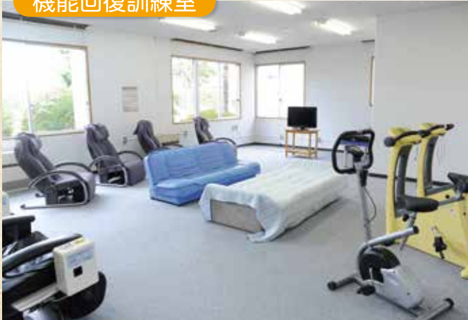
機能回復訓練室でゆっくりマッサージ。リラックス！