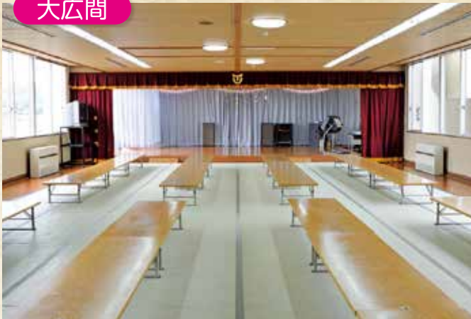
カラオケ・ダンス等が楽しめます。専属の司会で「プロ」気分！